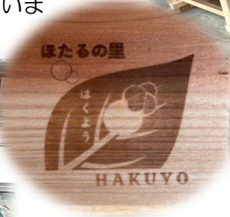
自治協が作成したベンチは、『ほたる鑑賞スポット』に設置します。

1/25(日)、ほたる水路の草刈りを行いました。吹雪降りしき中、水路周辺の草刈りをして頂きました。寒い中ありがとうございました。