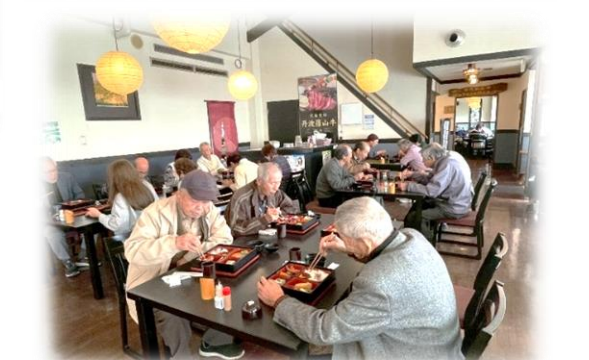
篠山牛コロッケ&黒豆豆腐の昼食

11/14(金)、種生改善センターで行われている『種生おしゃべりサロン』にお邪魔しました。美味しいコーヒーとおやつなどでくつろぎながら、楽しいひとときを過ごしました。今回は、シロヤギ堂鍼灸さんをお招きし、鍼灸体験をしました。