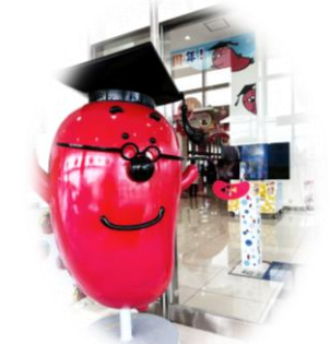
めんたいパーク タラコン博士

昼食後、「特産館ささやま」や「めんたいパーク神戸三田」に立ち寄り、お買い物を楽しみました。帰路には、恒例の「ビンゴゲーム大会」で、笑いとお嘆きと喜びの声が車中に響き、大いに盛り上がりました。片道3時間の長旅でしたが、事故もなく無事研修を終えることができました。ありがとうございました。