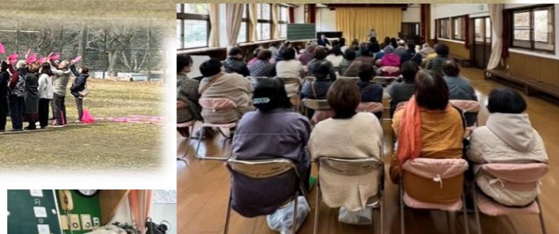
カレーを食べて みんな笑顔 ( ^ )