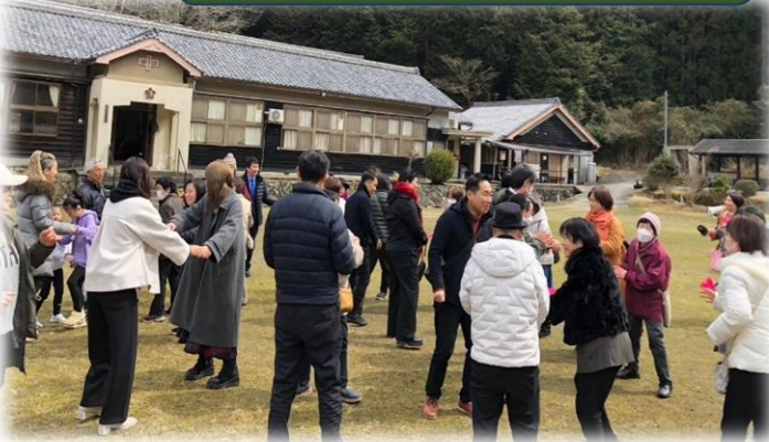
青山讃歌を皆で楽しく踊りました