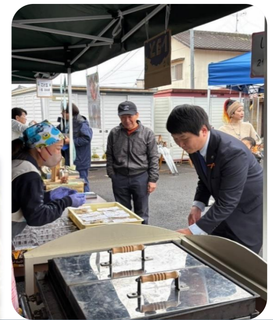
市長にもしらもちをお買い上げ頂きました