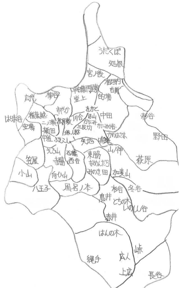
種生の旧小字(判明した小字を記載した)